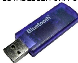
FIG. 3. DISPOSITIVO USB QUE PERMITE ESTABLECER UNA CONEXIÓN TIPO BLUETOOTH