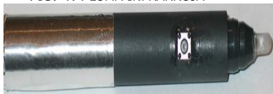
FIG. 4. PLUMA INFRARROJA