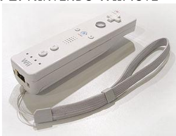
FIG. 2. NINTENDO WIIMOTE